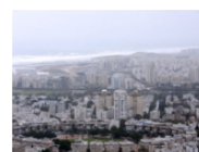
במקביל, ההעלאות הסיטונאיות בתעריפי הארנונה בשנים האחרונות מחיבות את הממשלה לשקול האם מובדק לאפשר לרשויות סמכות מלאה ועצמאית לניהול תקציבן

מדיניות נפוצה אצל הרשויות לצורך פיתוח אזורים מסוימים היא משל 'ארנבת וציידים' – העירייה, תמורת ארנונה מופחתת מפתה, מפעל או מרכז קניות להקים משכנו באזור מסוים שהיא חפצה ביקרו, וזה כבר מושך אחריו עסקים ומפעלים אחרים. דוגמא מפורסמת ומוצלחת היא של "איקאה"